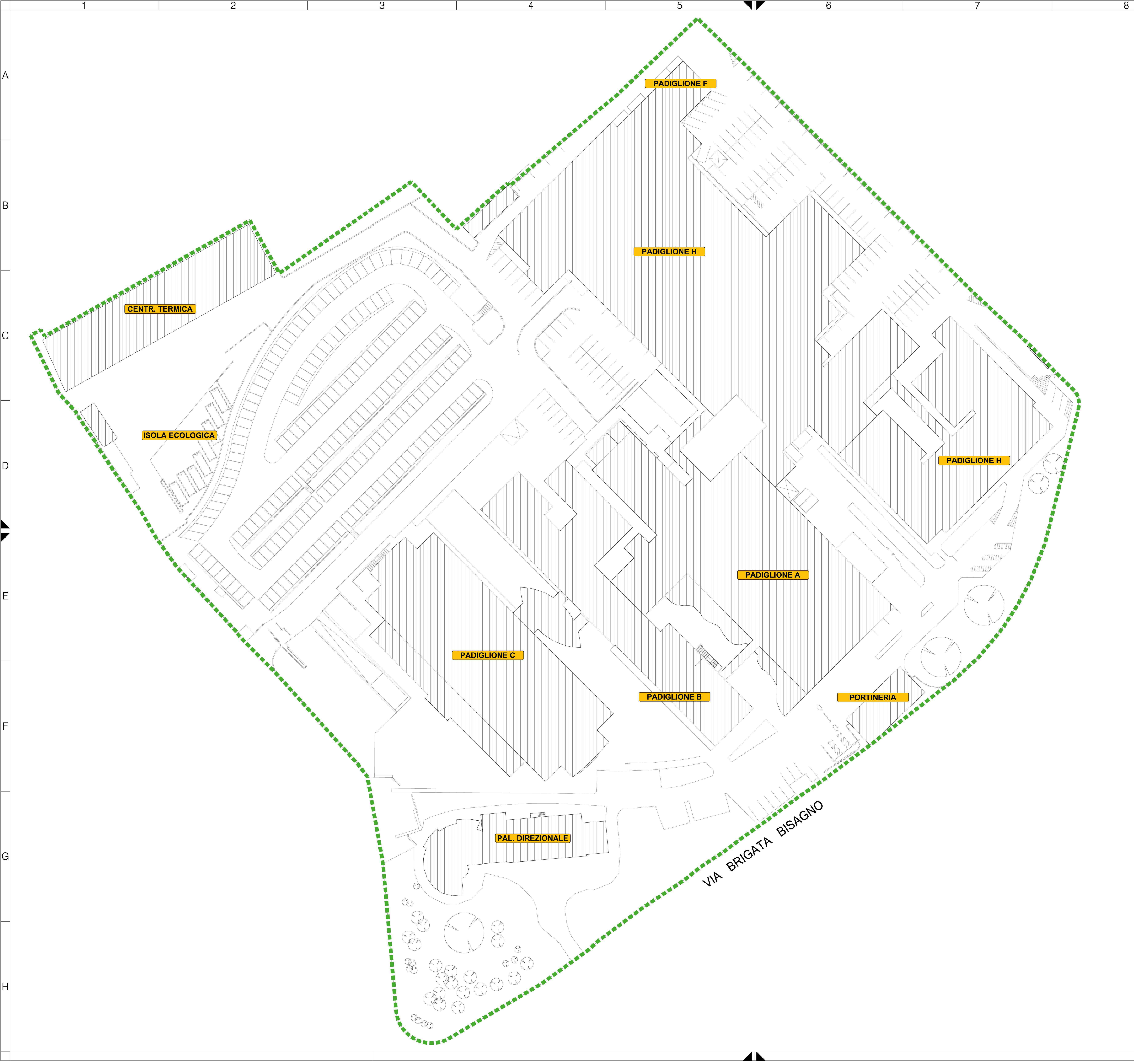
PLANIMETRIA GENERALE P.O. CONEGLIANO scala 1:500